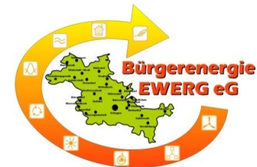
Ausgaben WKA Mühlhausen, ab 2020 Forecast